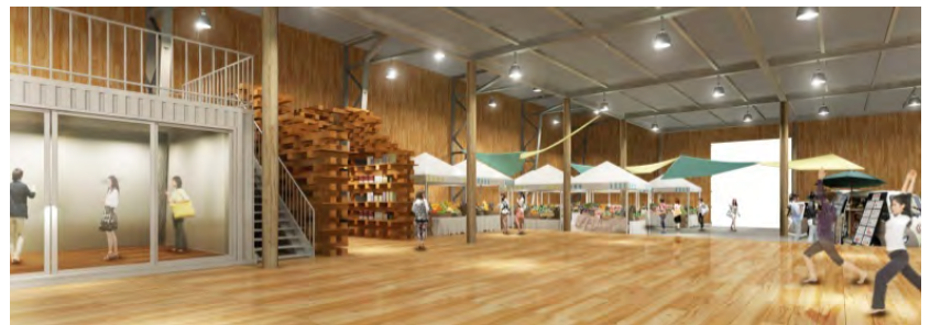
FOODARTS STUDIO KACHIDOKI