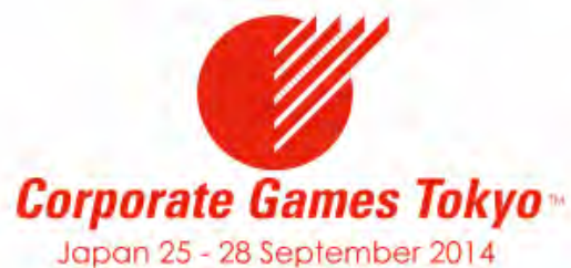
ザ・コーポレートゲームズ 東京 2014