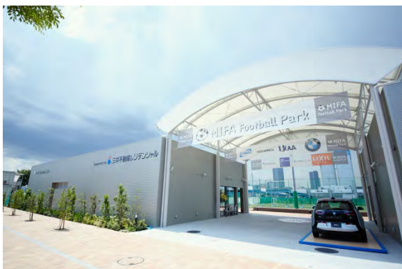
MIFA Football Park