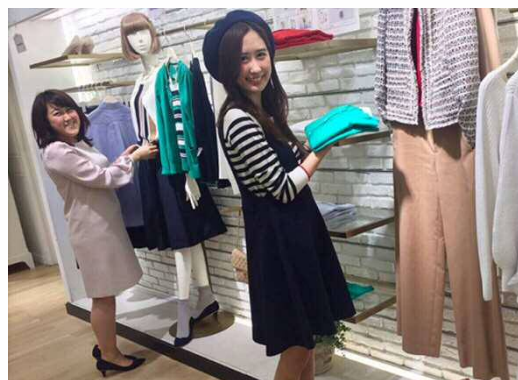
オンワード樺山「第1回 SHOP BLOG AWARD」より